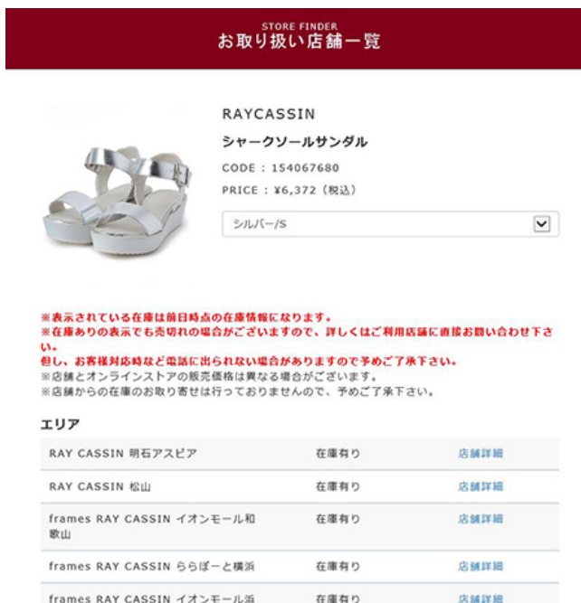
レイカズンオンラインショップ 店頭在庫表示機能

株式会社レイ・カズン公式サイト : http://www.raycassin.jp/